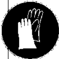
PROTECTION DES MAINS