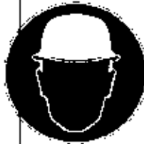
PROTECTION DE LA TÊTE