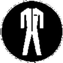
PROTECTION DU CORPS