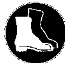
PROTECTION DES PIEDS