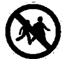
INTERDIT DES ENFANTS