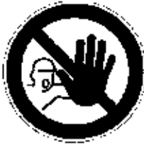
INTERDIT AUX PERSONNES NON AUTORISÉES